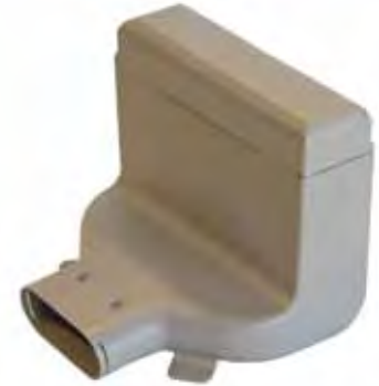
CLF 90x110x110 mm