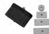
ComfoSet flat 51