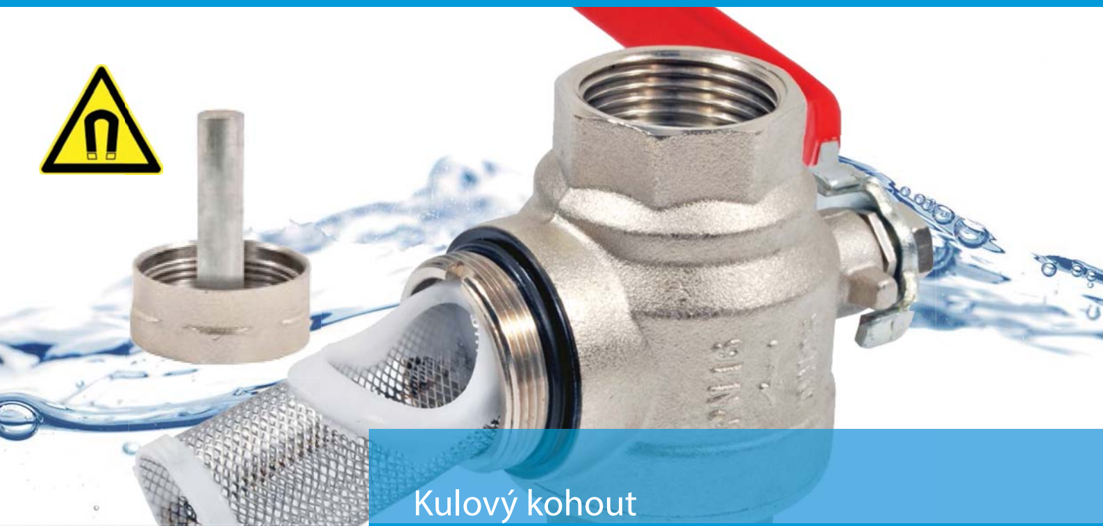
Kulový kohout s filtrem a magnetem